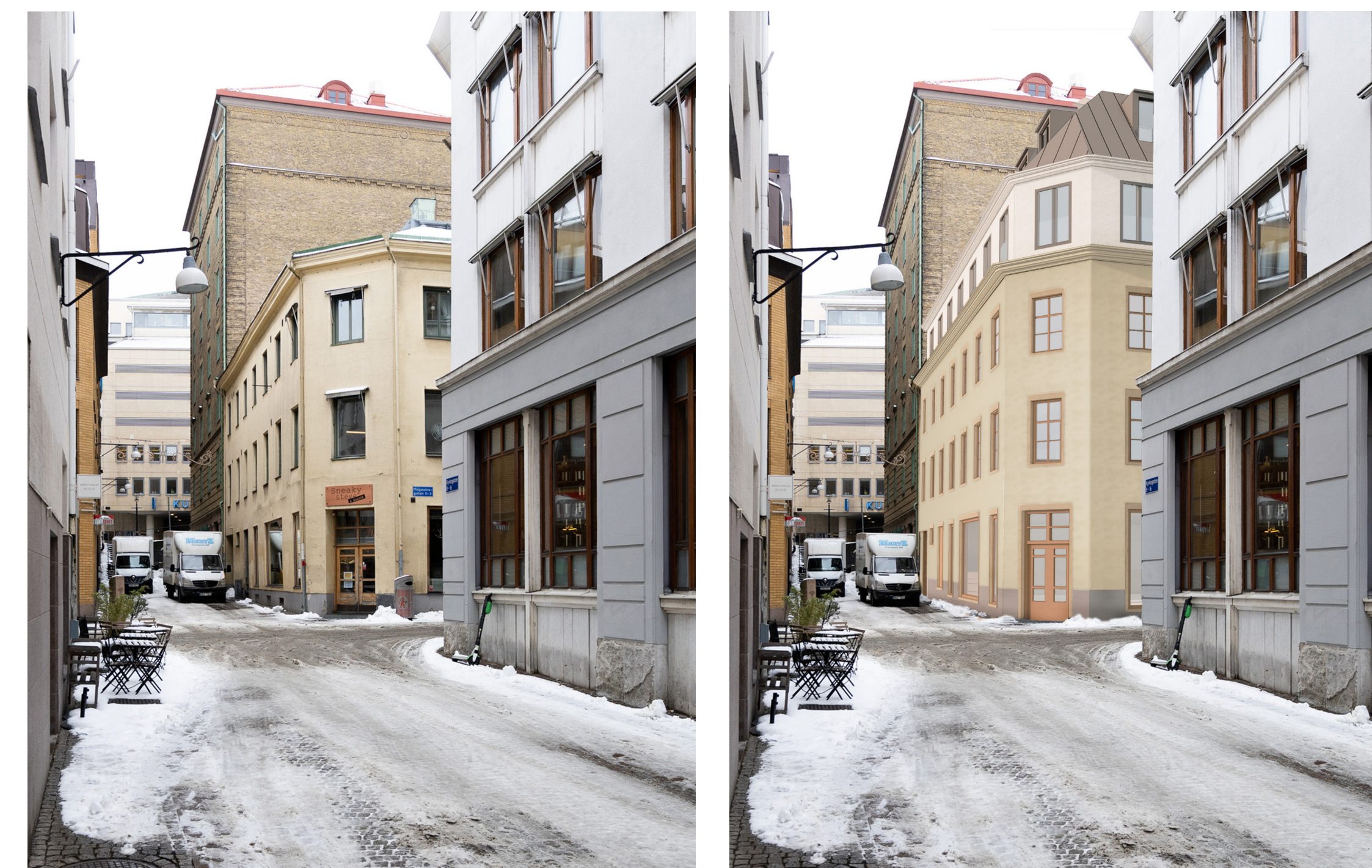
Befintligt utseende respektive en möjlig utformning, vy från Kyrkogatan österifrån. Idéskiss: Semrén och Månsson.